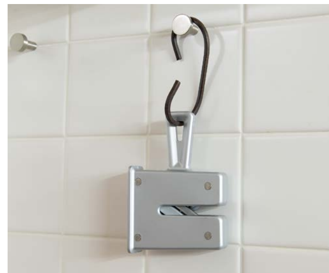
フック掛けが可能

テイラーズ アイ ウィットネス ミニ シャントリーシャープナー ブラック JAN 4562191983532 W130×D25×H105 (mm) ¥4,290 (税込)