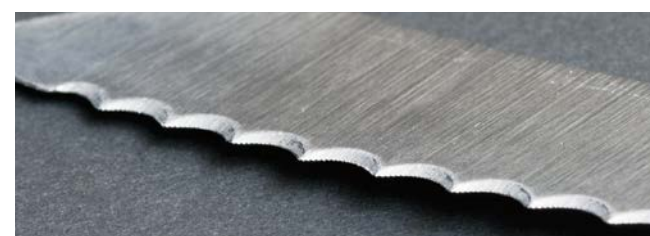
波刃も研ぐことが可能