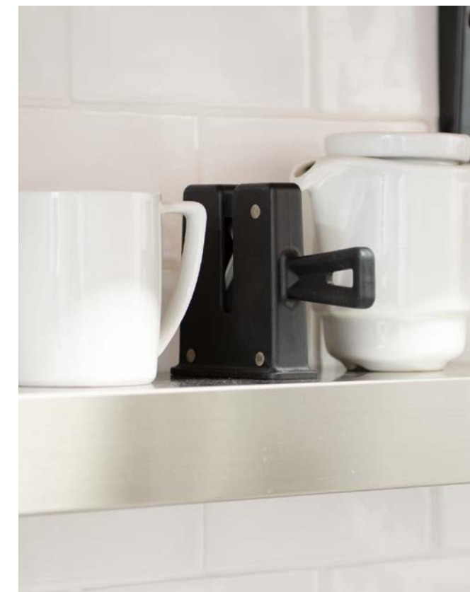
場所を取らないコンパクトサイズ